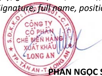
PHAN NGỌC SƠN

(Ký, ghi rõ họ tên, chức vụ, đóng dấu) (Signature, full name, position, and seal)